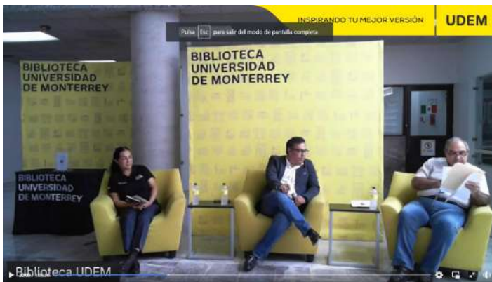
Presentación del libro "El pequeño alquimista" 20 de septiembre 2022

Extendemos la invitación a otros ex-alumnos que se quieran sumar a esta iniciativa que comparte el interés por la lectura, la difusión y el sentido de pertenencia.