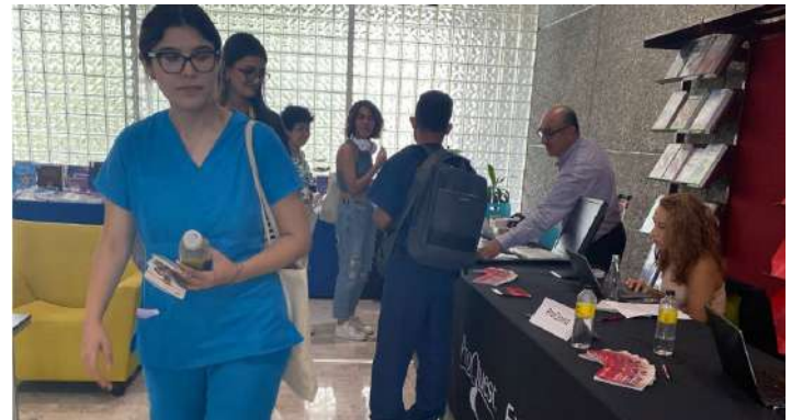
5º Feria de la Información 24 a 26 de agosto de 2022