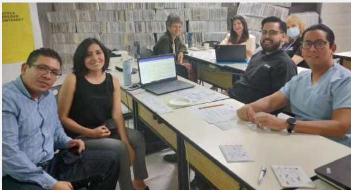
Trasciende en la investigación 27 de septiembre 2022