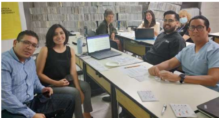
Trasciende en la investigación 27 de septiembre 2022