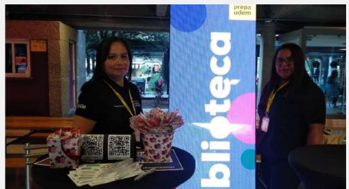
Evento IMAGINA, Prepa UDEM San Pedro 18 de octubre 2022