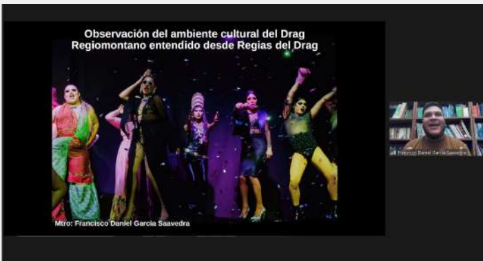
A pie de página: la cultura drag regiomontano 30 de marzo 2022